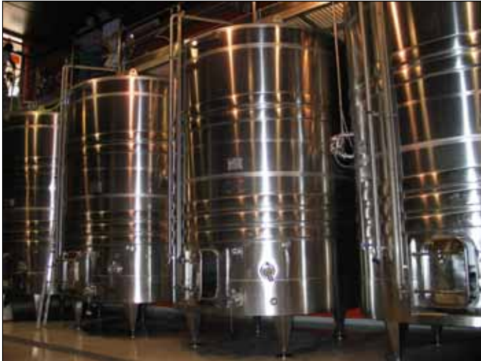
Domaine Chasson - Roussillon Cotes Du Rhone – FRANCE n. 4 – 15.000 Lt. ; n. 1 – 6.000 Lt.