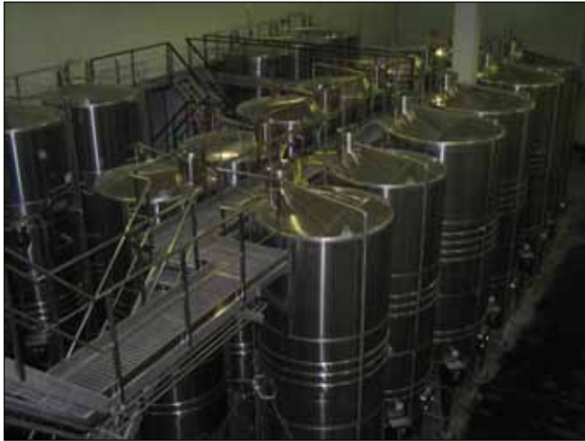
Château de Cransac (Sud- Ouest)- FRANCE n. 8 – 21.000 Lt., n. 4 da 14.000 Lt., n. 2 – 8.200 Lt.