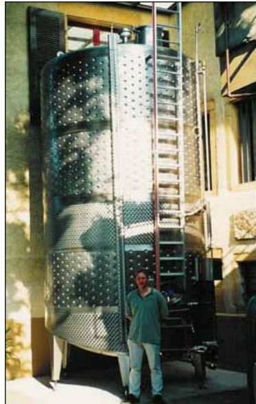
Werner K. Engel AG – SUISSE n. 1 – 15.000 Lt.