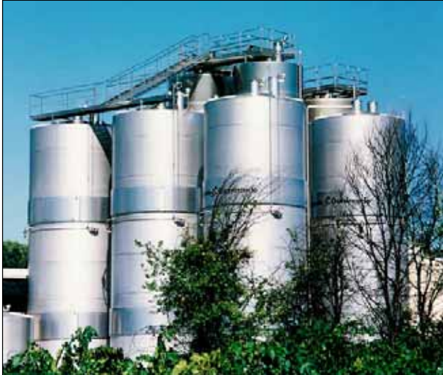
Cantine Valsinello Pollutri CH (Abruzzo) - ITALIA n. 8 - 120.000 Lt.