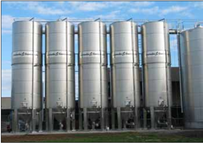
Forchir Talmassons (Friuli) - ITALIA n. 5 - 37000 Lt.