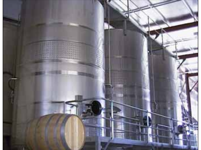
James Estate Wines (Hunter Valley) – SOUTH AUSTRALIA n. 3 – 32.000 Lt.