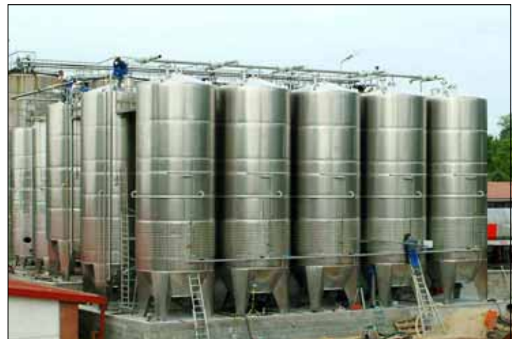
Varga Pincészet Kft – HUNGARY n. 10 – 60.000 Lt., n. 3 da 50.000 Lt., n. 4 – 40.000 Lt.