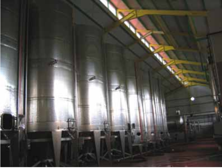
Sodap Coop. CYPRUS n. - 750.000 Lt.