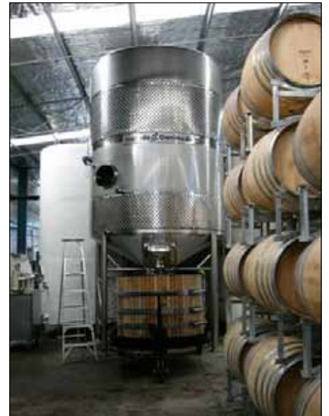
Wither Hills (Marlborough) NEW ZEALAND n. 1 – 15.000 Lt.