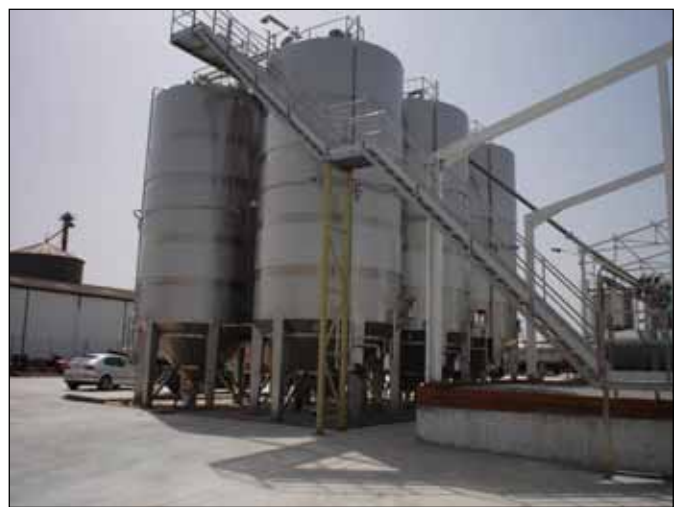
Inagroga S.A.T. 2485 Los Santos de Maimona (Badajoz) - ESPAÑA n. 6 - 100.000 Lt.