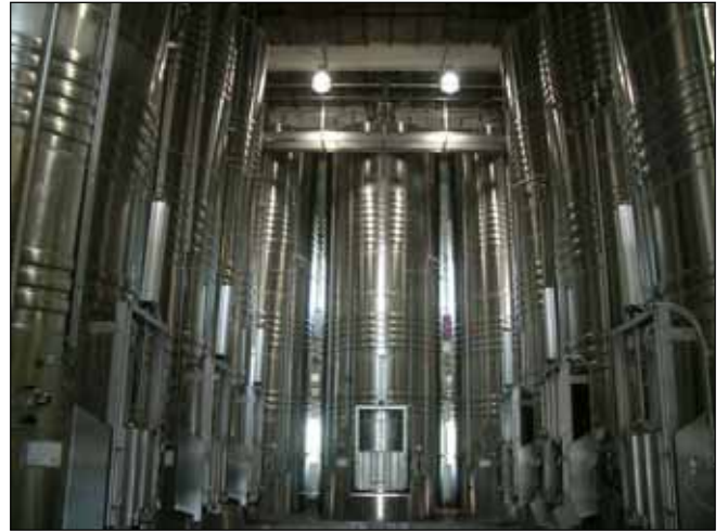
Cave Vinicole de l'Île de Ré (Charente) - FRANCE n. 9 – 62.000 Lt.