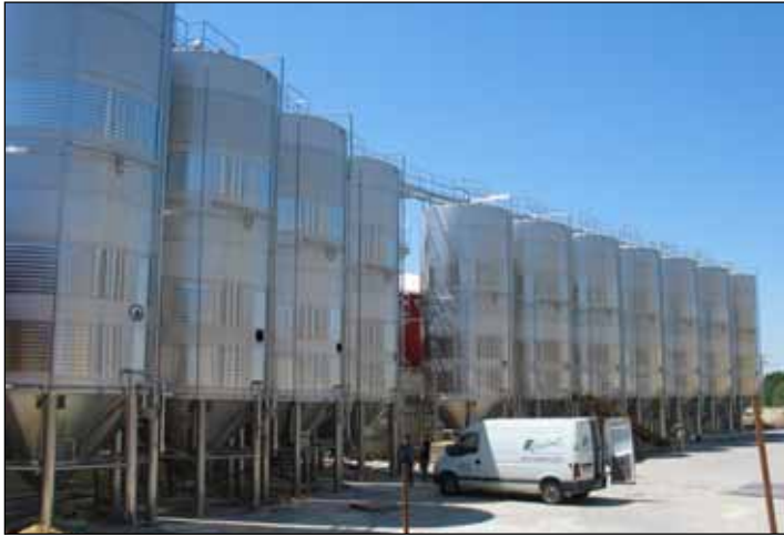
Coop. Agr. Santa Quiteria Higuera Albacete (Castilla-La Mancha) - ESPAÑA n. 11 - 165.000 Lt.