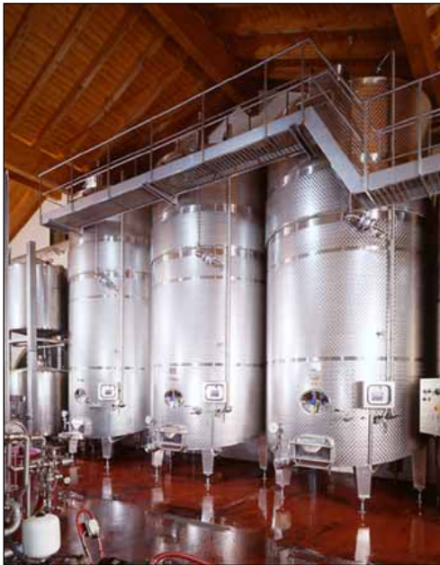
Agricola Mazzolada Lison di Portogruaro (Veneto) - ITALIA n. 5 - 26.000 Lt.