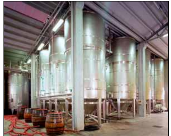
C.S. Opitergina Mottense Oderzo (Veneto) - ITALIA n. 15 - 40.000 Lt.