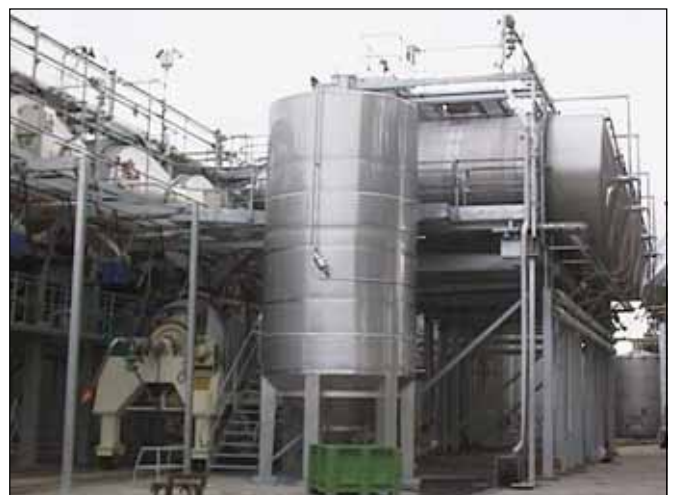
Southcorp Wines (Coonawarra) – SOUTH AUSTRALIA n. 1 – 25.000 Lt.