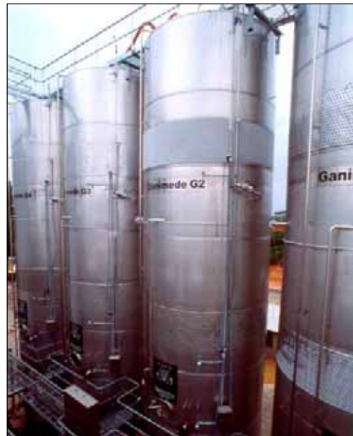
Tandou Winery (Monash) – SOUTH AUSTRALIA n. 4 – 80.000 Lt., n. 4 – 133.000 Lt.