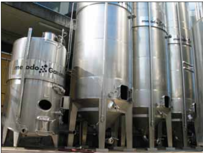
C.A.B. Coop. Agricola Brisighella a r.l. Brisighella (Emilia Romagna) - ITALIA n. 4 - 90.000 Lt. ; n. 4 - 38.000 Lt; n. 1 - 5.000 Lt.