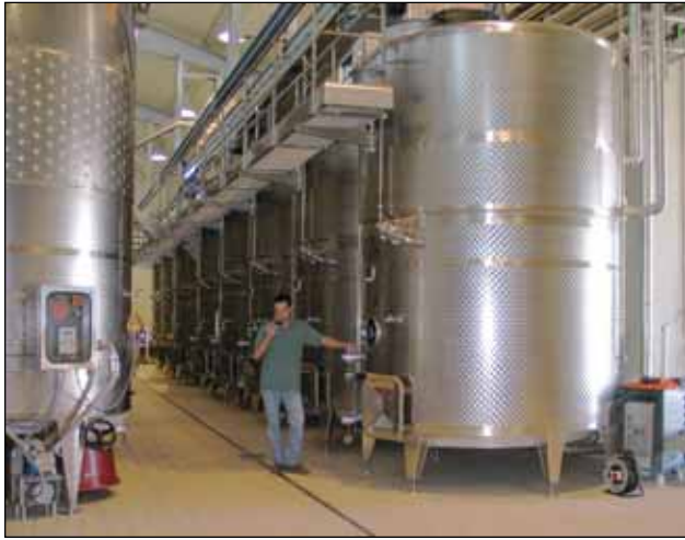
Tenuta Santomè Roncade TV (Veneto) – ITALIA n. 8 – 17.000 Lt.