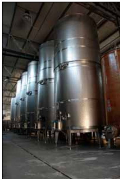
Pitars Cantina S. Martino di Pittaro S. Martino al T. (PN) Friuli IT n. 5 – 25.000 Lt. utili