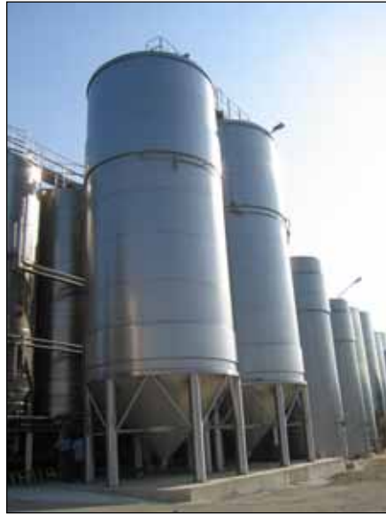
Can. Soc. Madonna Sant. di Loreto Torino di Sangro (CH) Abruzzo IT n. 2 – 225.000 Lt.