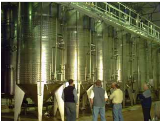
KWV (Paarl) – SOUTH AFRICA n. 4 – 12.000 Lt.