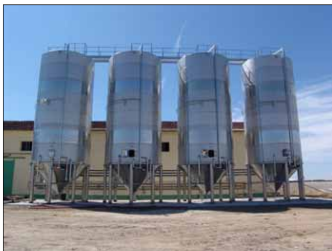
Coop. Agr. Fuensalida Toledo (Castilla-La Mancha) - ESPAÑA n. 5 - 165.000 Lt.