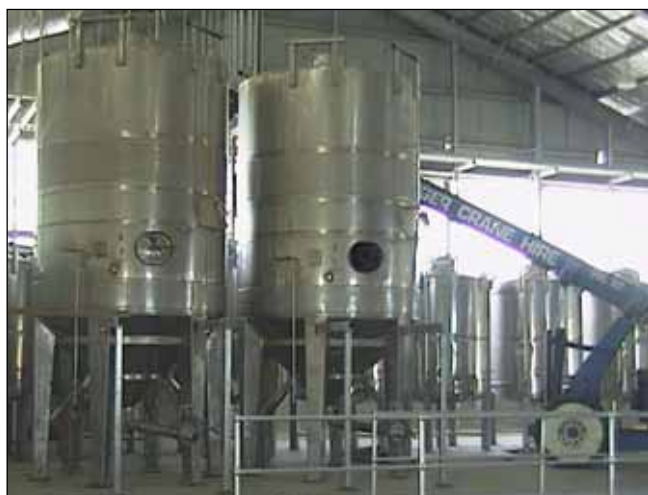
Kreglinger (Mount Benson) – SOUTH AUSTRALIA n. 2 – 20.000 Lt.