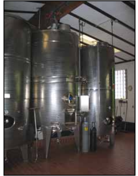
Weingut Martin Oppenheim GERMANY n.1 - 6.000 Lt.