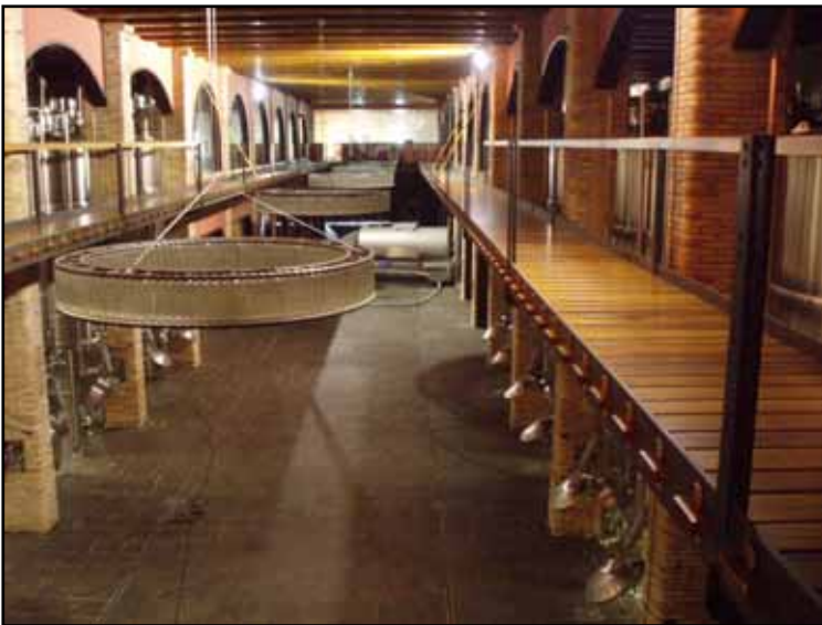
Bodega Juan Francisco Rosa La Geria Islas Canarias - ESPAÑA n. 3 - 1.500 Lt.; n. 1 - 3.000 Lt.; n. 5 - 11.000 Lt.; n. 18 - 15.000 Lt.