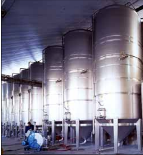
Santa Margherita S.p.A. Fossalta di Portogruaro (Veneto) - ITALIA n. 2 - 16000 Lt., n. 5 - 25.000 Lt., n. 4 - 35.000 Lt.