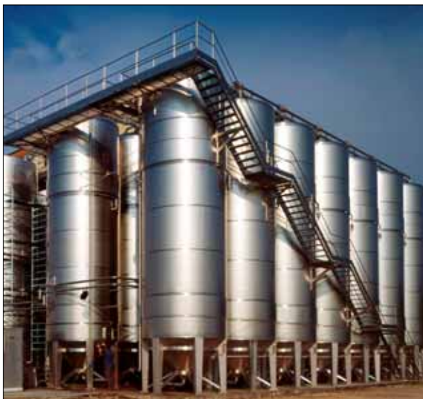
C.S. di Campodipietra Salgareda (Veneto) - ITALIA n. 14 - 75.000 Lt.