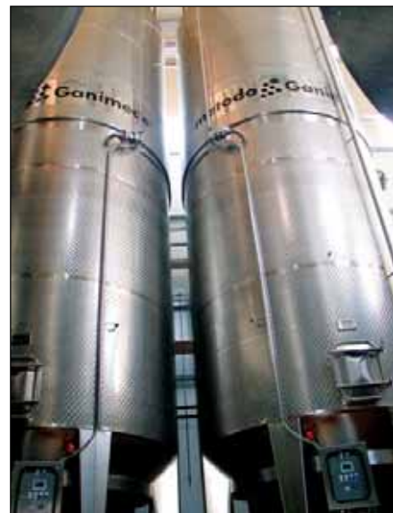
C.S. di Dolianova Cagliari (Sardegna) - ITALIA n. 6 - 50.000 Lt.