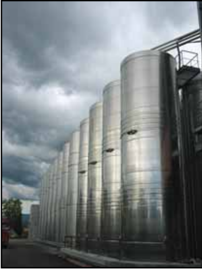
Can. Soc. di Vittorio Veneto (TV) Veneto IT n. 4 – 85.000 Lt.