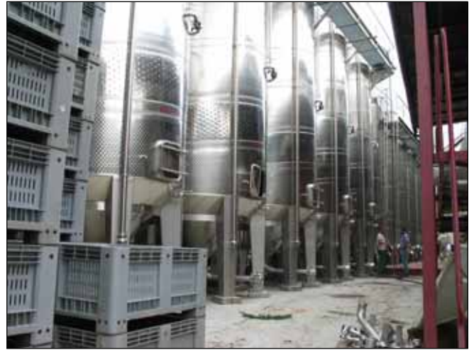
Cantina Le Meridiane Soc. Coop. a r.l. Trento (Trentino Alto Adige) – ITALIA n. 5 – 38.000 Lt.