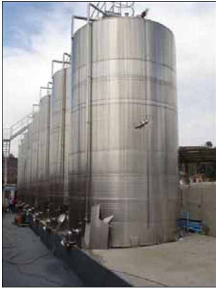
Coop. Loncomilla – CHILE n. 8 – 100.000 Lt.