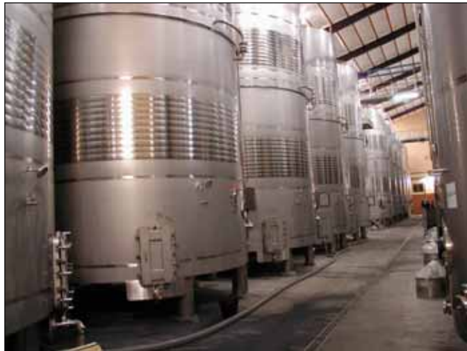
Bodega Montecillo - OSBORNE GROUP Navarrete (La Rioja) - ESPAÑA n. 20 - 100.000 Lt.; n.1 - 25.000 Lt.