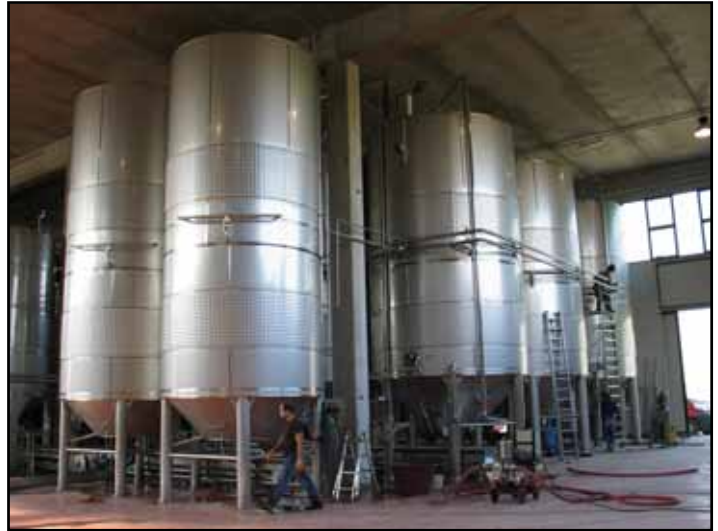
Can. Soc. di Castelnuovo del Garda (VR) Veneto IT n. 2 – 60.000 Lt.; n. 6 – 80.000 Lt.