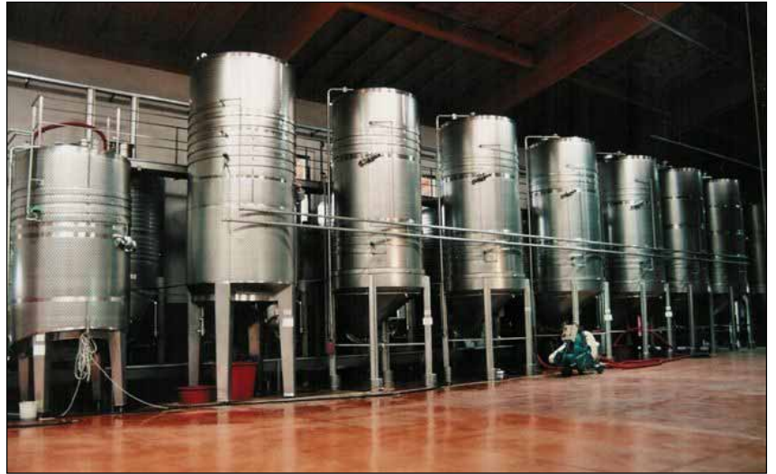
Pasqua Vigneti e Cantine S.p.A. Verona (Veneto) - ITALIA n. 10 - 15.000 Lt., n.1 - 7.500 Lt.