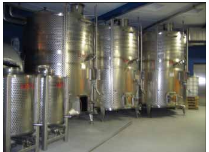
Alois Lageder Spa Magrè BZ (Trentino Alto Adige) - ITALIA n. 3 - 14.000 Lt.