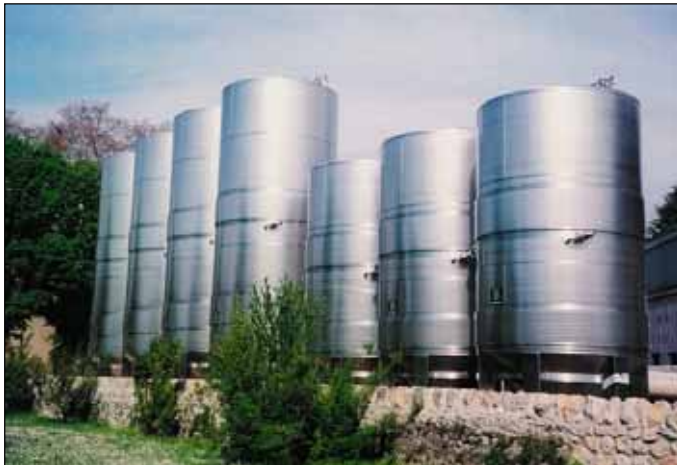
F.lli Bolla S.p.A. Pedemonte di Valpolicella (Veneto) - ITALIA n. 3 - 30.000 Lt., n. 4 - 60.000 Lt.