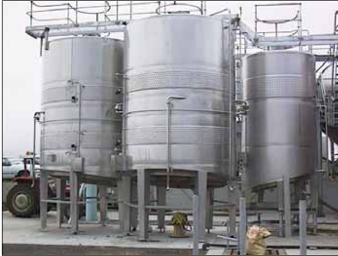
Hamilton Wine Group-Leconfield (Coonawarra) – SOUTH AUSTRALIA n. 1 – 10.000 Lt., n. 2 – 21.000 Lt.