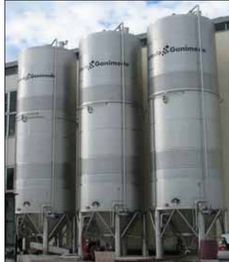
Vecchia Cantina di Montepulciano Siena (Toscana) - ITALIA n. 1 - 60.000 Lt., n. 16 - 120.000 Lt.