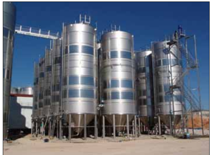
Coop. Agr. Santa Cruz Alpera Albacete (Castilla- La Mancha)- ESPAÑA n. 15 da 200.000 Lt.