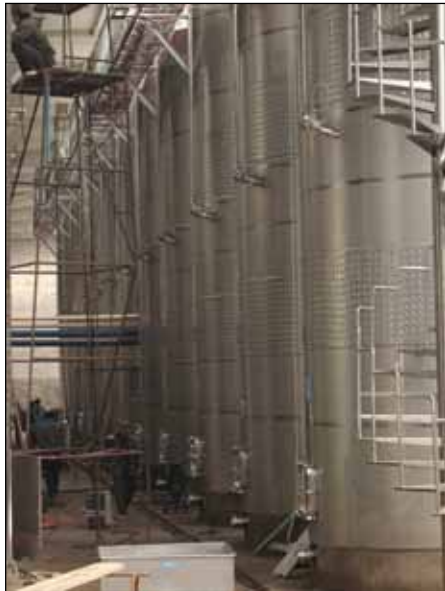
Ningxia – CHINA n. 12 – 65.000 Lt.