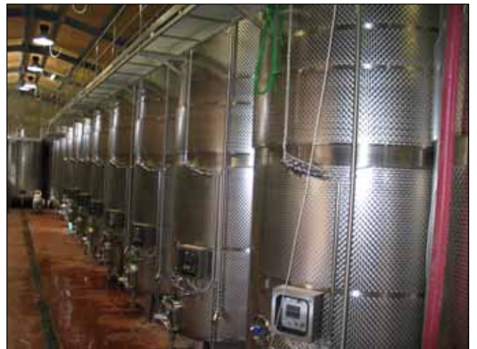
Cinelli Colombini - Fattoria dei Barbi Montalcino (Toscana) - ITALIA n. 9 - 26.000 Lt.