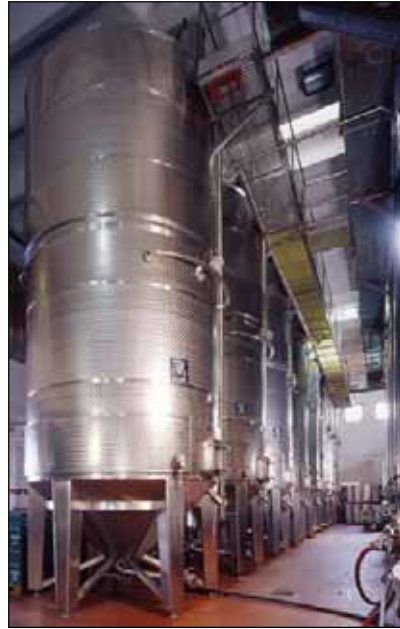
Tommasi Viticoltori Pedemonte di Valpolicella (Veneto) - ITALIA n. 8 - 40.000 Lt.