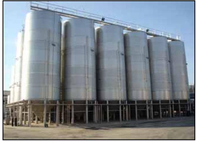
Coop. La Virgen de las Vignas de Tomelloso (La Mancha) ESPAÑA - Largest European Winery n. 15 - 200.000 Lt.