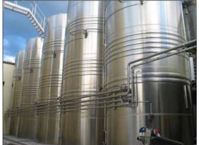
Cave de St Pantaleon Les Vignes Cotes Du Rhone - FRANCE n. 5 – 57.000 Lt.