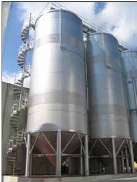
Cantina Sociale Colle Moro Guastameroli di Frisia CH (Abruzzo) n. 7 – 225.000 Lt.