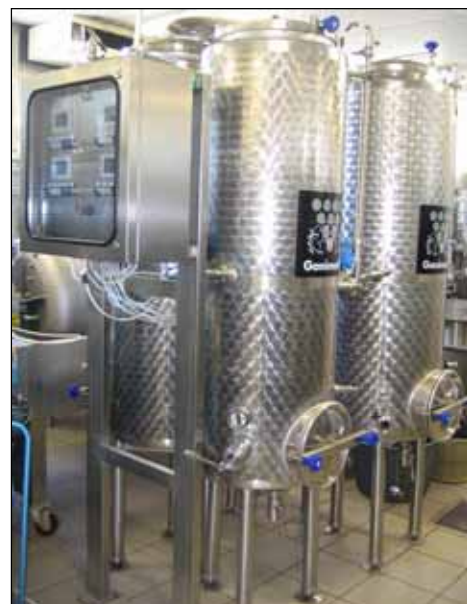
Vivai Coop. Rauscedo – CASA 40 Rauscedo PN (Friuli) – ITALIA n. 4 – 250 Lt.