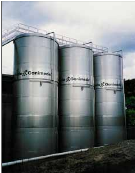
Cantina Sociale di Vacri Chieti (Abruzzo) - ITALIA n. 3 - 175.000 Lt.