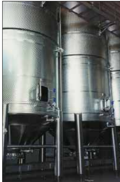
Fattoria Il Palagio Castel S. Gimignano SI (Toscana) n. 3 - 38.000 Lt.