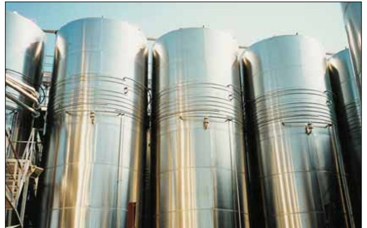
Cave de Fleury d'Aude (Languedoc Roussillon) - FRANCE n. 5 – 140.000 Lt.