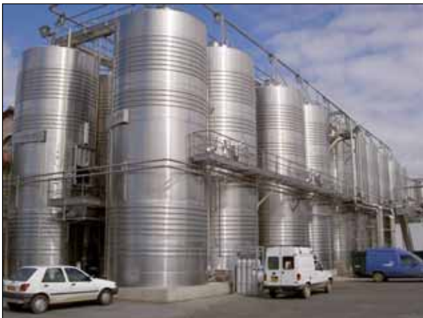
SCV les Vigerons d'Ouveillan (Languedoc Roussillon) - FRANCE n. 6 – 50.000 Lt.