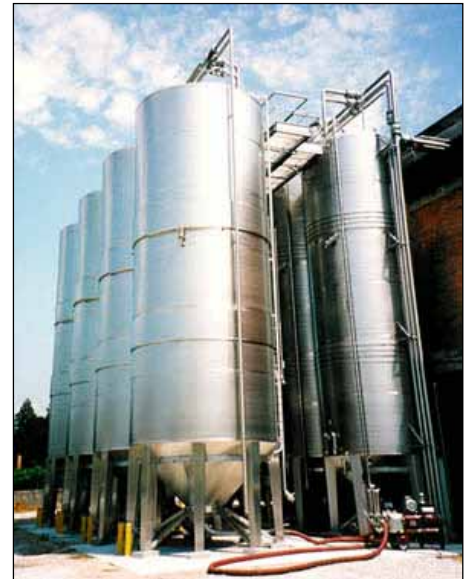
Cantina Sociale di Ramuscello Ramuscello PN (Friuli) - ITALIA n. 4 - 75.000 Lt. n. 4 90.000 Lt.