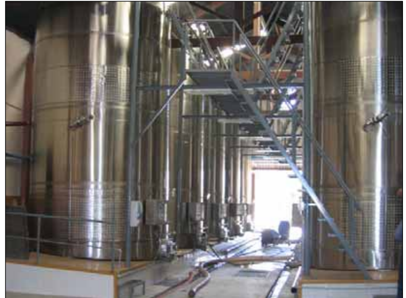
Coop. Ing. Giagnoni (Mendoza) - ARGENTINA n. 10 – 40.000 Lt.