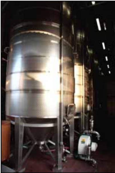
I Magredi Domanins (PN) Friuli IT n. 6 – 65.000 Lt. utili