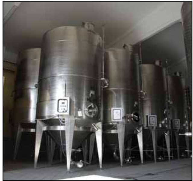
La Tunella Ippis di Premariacco(UD) Friuli IT n. 8 – 14.000 Lt.